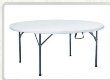
MESAS REDONDAS (10 PERSONAS)