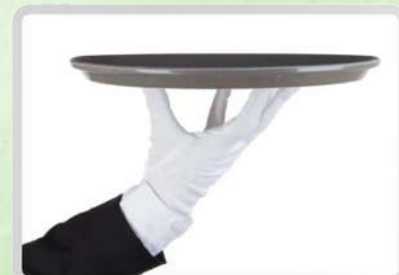
PROFESIONALES DE SERVICIO