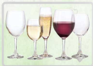
CRISTALERÍA Y MANTELERÍA