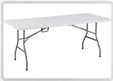
MESAS RECTANGULARES (6 PERSONAS)