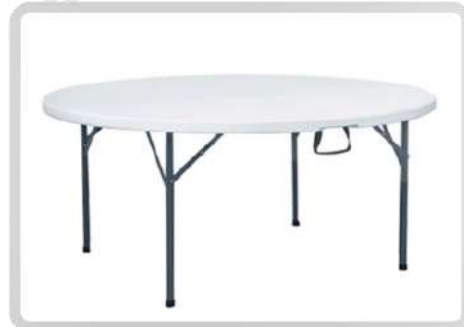
MESAS REDONDAS (10 PERSONAS)