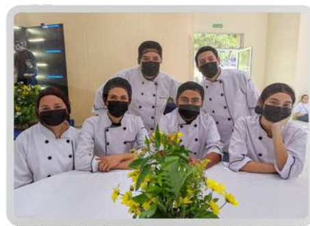
PROFESIONALES DE SERVICIO