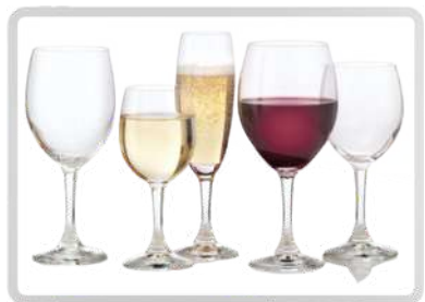
CRISTALERÍA Y MANTELERÍA