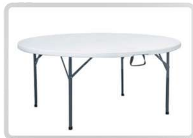
MESAS REDONDAS (10 PERSONAS)