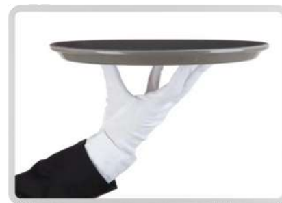
PROFESIONALES DE SERVICIO