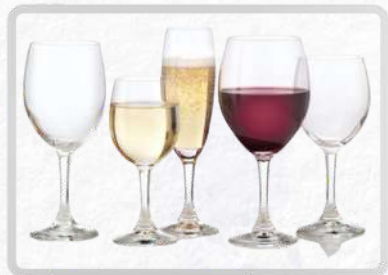
CRISTALERÍA Y MANTELERÍA