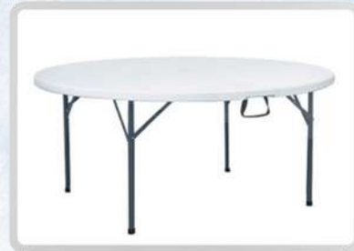
MESAS REDONDAS (10 PERSONAS)